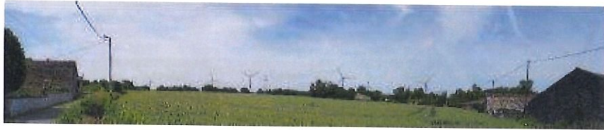
Point de vue n°9 :