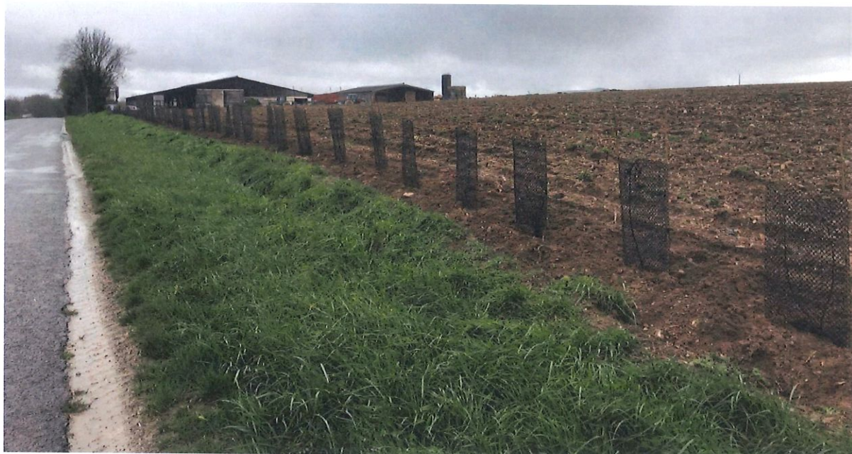
Plantation de 200 mètres linéaires de haies champêtres