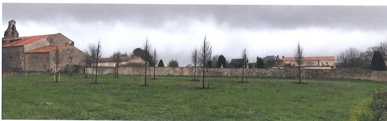
Plantation de 10 tilleuls