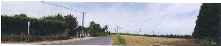
Point de vue n°10 :