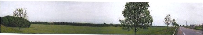
Point de vue n°12 :